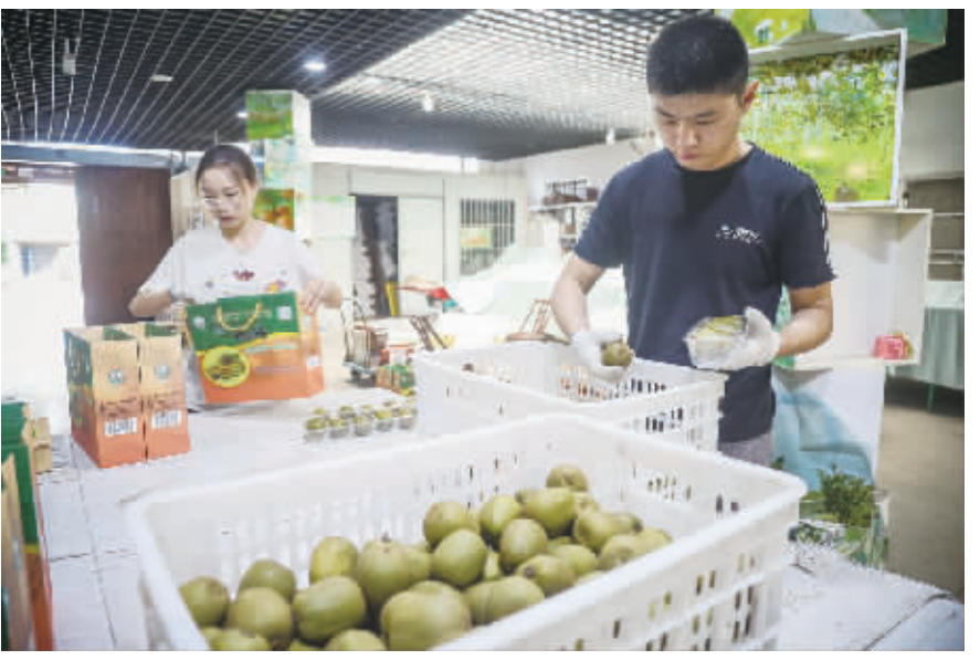
9月14日,六合区横梁街道绿航生态园内,工人们正在忙碌着分拣、包装。

南京最大的猕猴桃生产基地,拥有金魁、东红等10多个品种,按果肉颜色又分为红、黄、绿三个类型,可从8月一直采摘到11月。