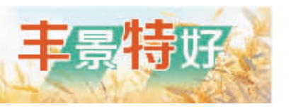
南京日报/紫金山新闻记者 孙敬清

昨天,正值周末,天朗气清,六合横梁东方红水库旁的绿航生态园车流不断。“请直接到A4片区,那边的猕猴桃处于后熟期。我已经检测过了,采回家放上5天左右就能吃。”