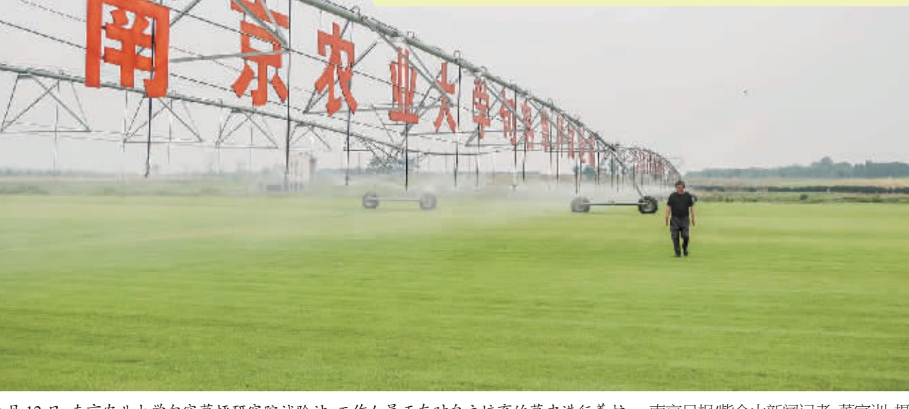
9月12日,南京农业大学句容草坪研究院试验站,工作人员正在对自主培育的草皮进行养护。