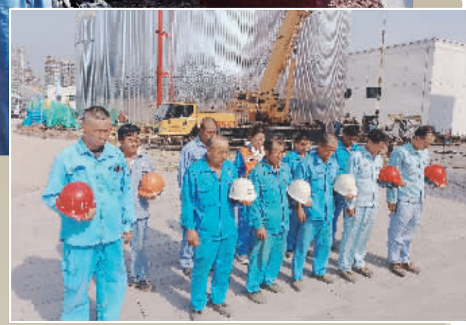
扬子炼油结构调整项目施工现场,工人举行默哀仪式。

起。秦淮区际华广场上,部分市民及工作人员150余人迅速进入紧急避险状态,按照防空预案开始疏散,仅用3分钟便全部安全撤离到人防工程内。 10时零8分,空袭警报响起。人防工程内心理医生在对全体疏散人员进行思想情绪的安抚教育,缓解他们的紧张恐惧情绪,并针对个别疏散人员进行心理辅导。同时,保障人员向居民发放生活和急救等物资。 10时16分,解除警报响起。在随即组织的医疗救护和消防灭火演示中,大光路社区卫生服务中心医护人员在为1名轻伤员进行包扎,并对1名重伤员进行紧急抢救后,用担架抬离现场,紧急送至医院,进行后续救治。针对空袭后引发的大火,消防专业队车辆拉响消防警报入场,展开消防灭火行动。 “请大家关好门窗,收拾好自己的书本物品,按照出操队形,迅速撤离至学校操场。”伴随着防空警报的鸣响,位于六合区马鞍学校的学生们也按照指令迅速疏散转移…… 据介绍,此次疏散演练活动旨在以快速、安全、有序疏散及最大限度减少人员伤亡为目标,帮助师生熟悉防空警报信号、战时疏散和隐蔽程序,提高师生的防空疏散处置能力。 市国动办相关负责人介绍,防空警报试鸣期间,全市各区共开展了22场防空演练和宣教活动,1万余名机关干部、企事业单位职工、社区居民、在校师生参加活动,为战时组织好人口疏散掩蔽行动积累了经验。