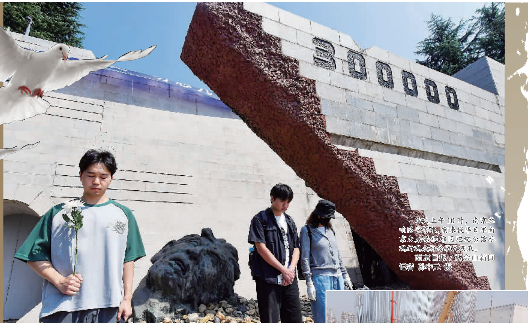
昨天上午10时,南京拉响防空警报,前来侵华日军南京大屠杀遇难同胞纪念馆参观的观众纷纷驻足默哀。