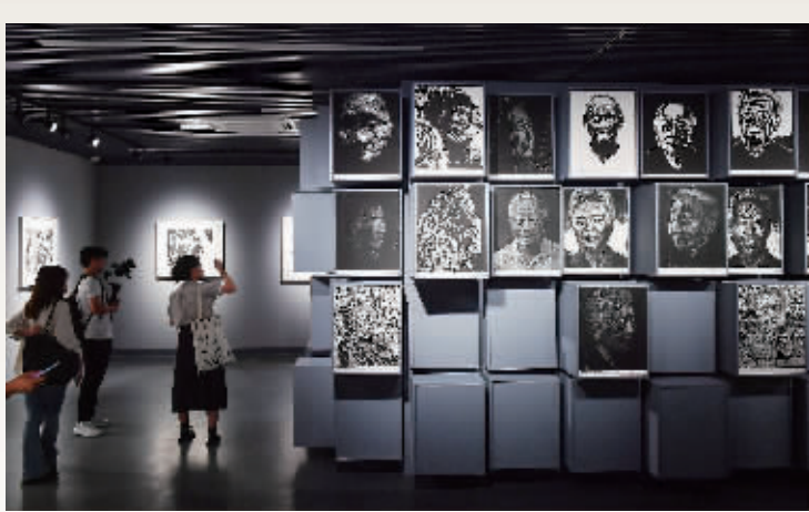
昨天,市民正在参观画展。

本报讯(记者 江瑜 见习记者 戚珂嘉)9月18日,“永远的铭刻——抗战历史记忆版画展”在侵华日军南京大屠杀遇难同胞纪念馆开幕。版画展由中国美术馆、侵华日军南京大屠杀遇难同胞纪念馆、金陵美术馆共同主办,江苏省美术馆支持。南京版画家程勉创作的《血——南京大屠杀木刻系列组画》,被纪念馆永久收藏并在本次展览中展出。 此次版画展精选百余幅作品,向观众集中呈现了二十世纪三四十年代李桦、王琦、古元、彦涵、力群等第一代新兴版画艺术家和当代版画创作者的杰作。版画展由“铁蹄之下”“南京浩劫”“抗争到底”“万众一心”“记忆传承”五个关键词串联。 《血——南京大屠杀系列木刻组画》,由14幅小尺度版画和1幅主体性画作组成,主体性画作为《血——公元1937.12.13》