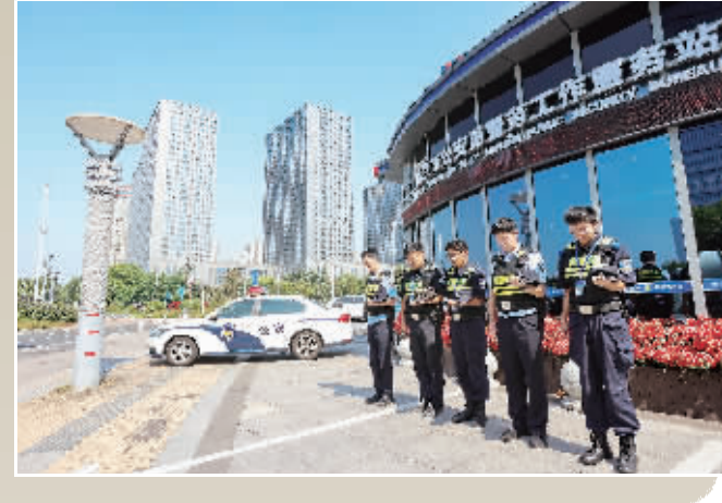
建邺区奥体警务工作服务站的民警肃立默哀。