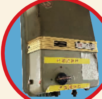
直排式燃气热水器早已禁用。