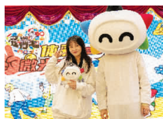
“越努力,越美好”微光市集活动现场

通过此次市集,南京体彩成功打破了传统活动的单一性,为市民提供了一个更多元的体彩体验。活动现场将购彩、公益与娱乐相结合,强化了“买体彩就是有益、有趣、有聊”的品牌认知。在这个浪漫的秋日,南京体彩与市民共同营造了积极向上的活动氛围,彰显了“越努力,越美好”的生活理念。活动的成功举办不仅为体彩品牌赢得了更多的关注,也为南京的时尚与生活美学注入了一股新的活力。